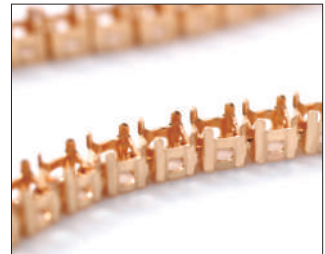
軽量で美しい仕上がり