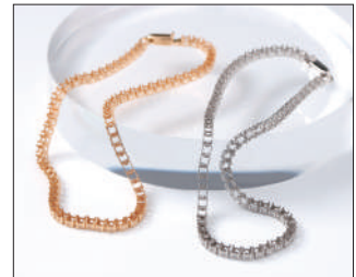
滑らかでしなやかな動き