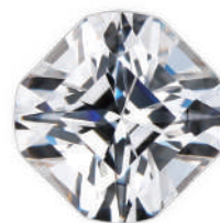
Crossfor Cut クロスフォーカット

クロスフォーが開発した、十字が浮かび上がる神秘的なカット「クロスフォーカット」を施した、キュービックジルコニアを使用しているシルバーアクセサリブランド。その神秘性から長く愛されているブランドでもあります。主にダンシングストーンと組み合わせたものが多く、キラキラと輝くアクセサリを数多く展開しています。