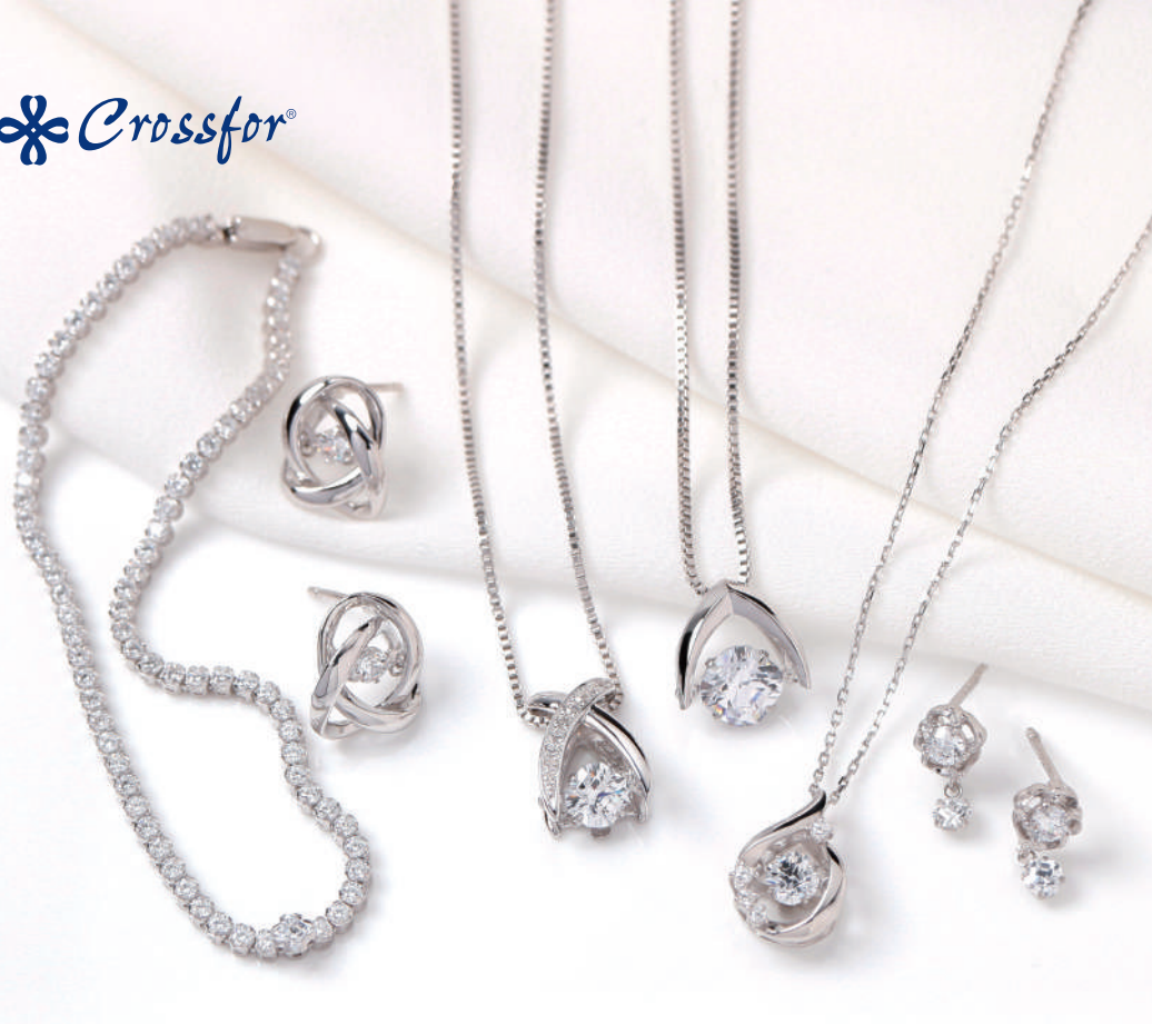
Silky Touch Tennis chain