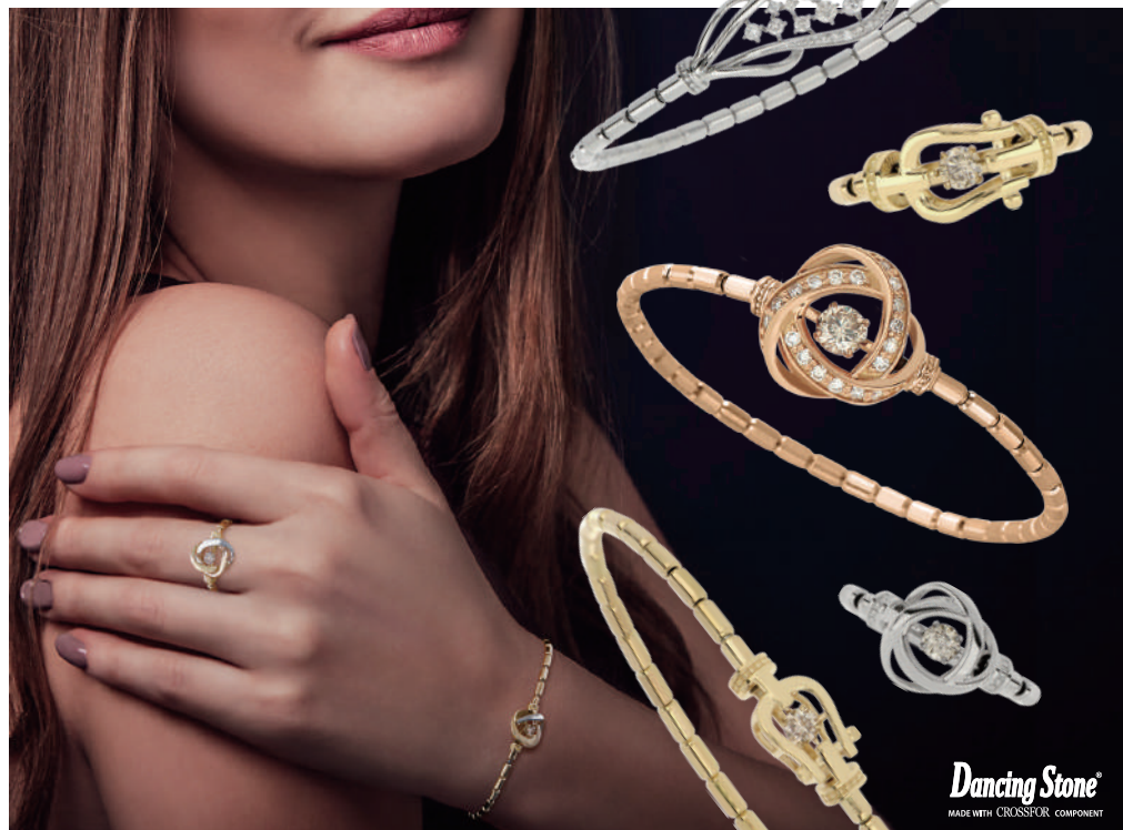
K18YG, K18PG, Pt900 / Diamond

Dancing Stone MADE WITH CROSSFOR COMPONENT