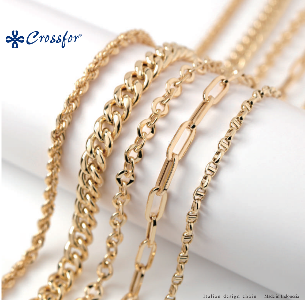
Italian design chain Made in Indonesia

Hollow chain with Italian design that combines volume and light wearing comfort.